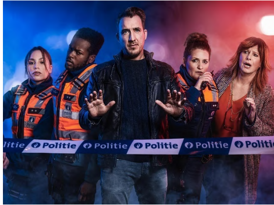
Che Dobbe Stine Sisto Grim