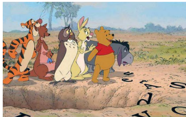
Veva, Kora, Frie, Zazoe, Lilyroe, Rikki

Hebben jullie ook al iets opgemerkt? Ons lokaal ziet er nog redelijk saai uit. Vandaag gaan we daar verandering in brengen! Tot dan lieve kunstenaars!